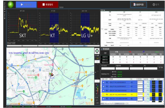
그림 3. 이동형 무선국 검사 측정 화면 Fig. 3. Measurement interface of the mobile wireless station inspection system.